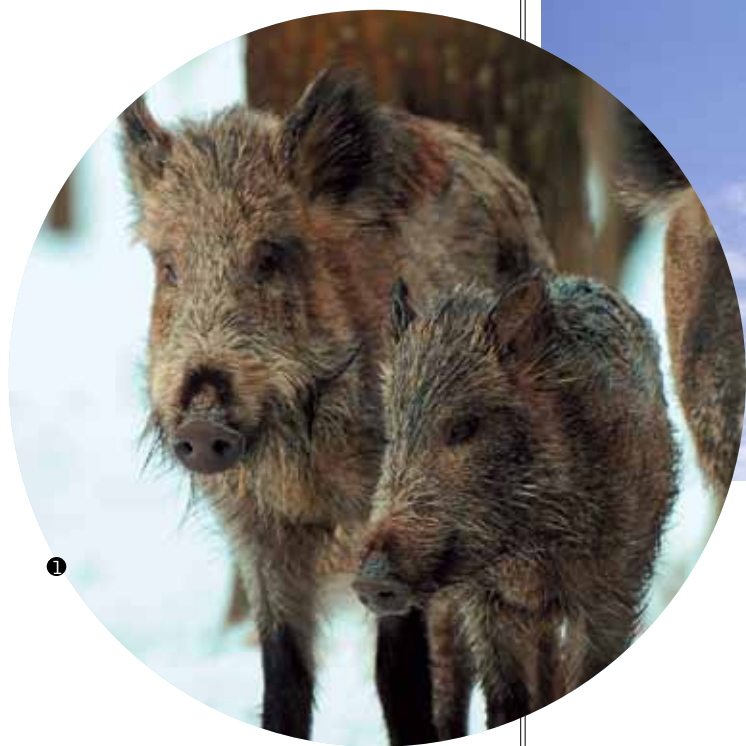
1 Кабанья молодежь.