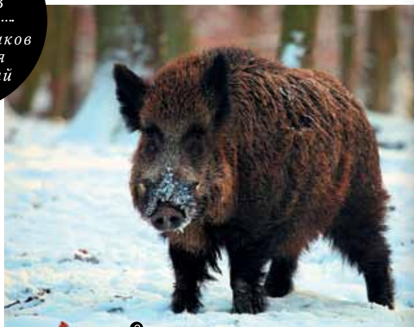
ФОТО НА ПАМЯТЬ!